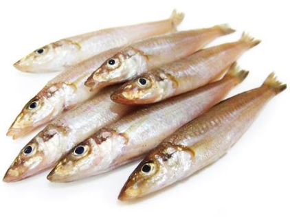
「夏のキスは 絵に描いたものでも食べ」と言われるほど

この度、瀬戸内プレカットは設立25周年を迎えることができました。今後とも、地域一番をめざし、従業員一同気持ちも新たに、より一層励んで参ります。そして、この金岡新聞も創刊3周年を迎えました。思い返せば『〇月生まれの有名人』は、創刊当時から人気コーナーで未掲載時、問合せを頂きうれしく思ったのを覚えております。2年目からは、『日本ロマン飛行』を開始。おかげさまで、看板シリーズとして定着させることができました。皆様からの応援と感想のお言葉に支えられ、本日まで創刊し続けることができましたこと、心より感謝致しております。毎号楽しみにされている皆様に、ますます充実した記事をお届けできるよう、これからも精進して参ります。